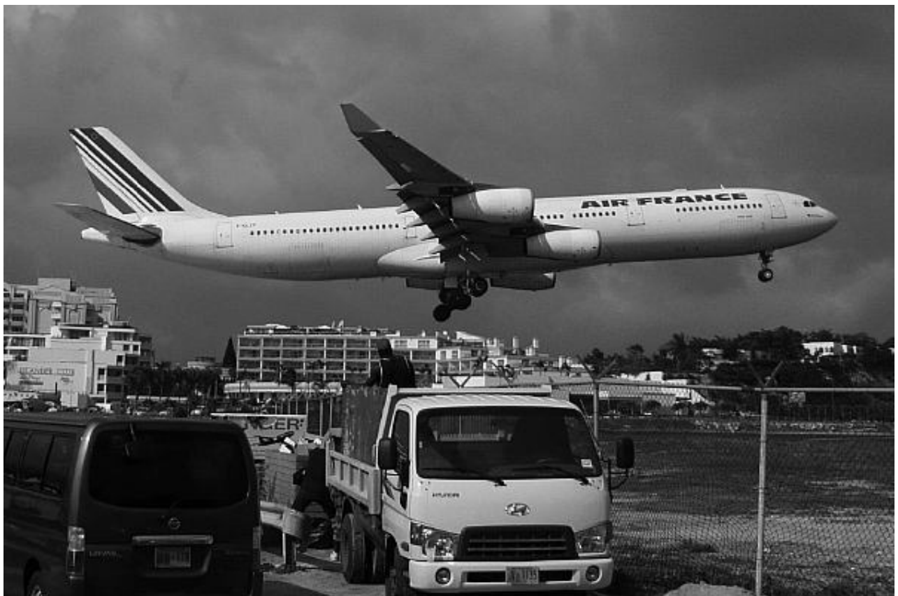
Airbus 340-300 Air France St. Maarten 18.1.2009

Auch in winterlichen Tauchferien können ACB-Mitglieder das Knipsen nicht ganz lassen: