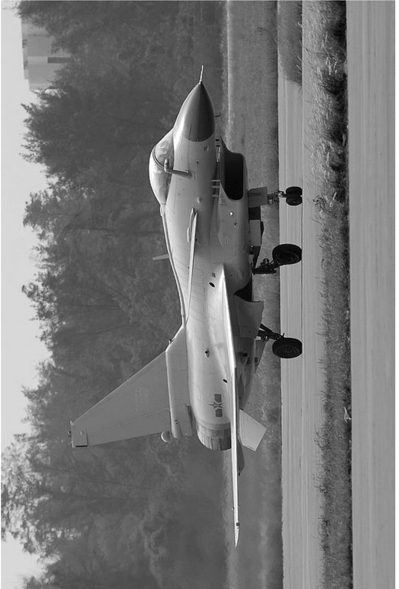
Chengdu J-10 „Vigorous Dragon“ in Zuhai (China) 5.11.2008