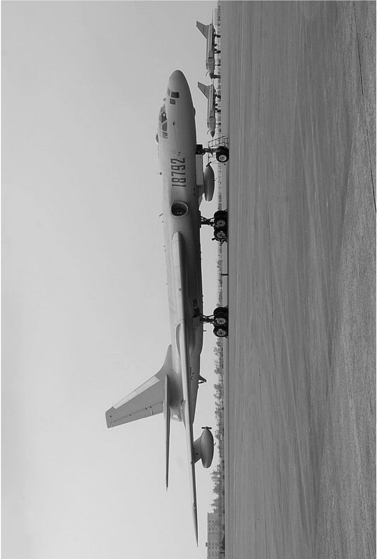
Xian H-6 & 2x Shenyang F8M-II in Zuhai (China) 6.11.2008